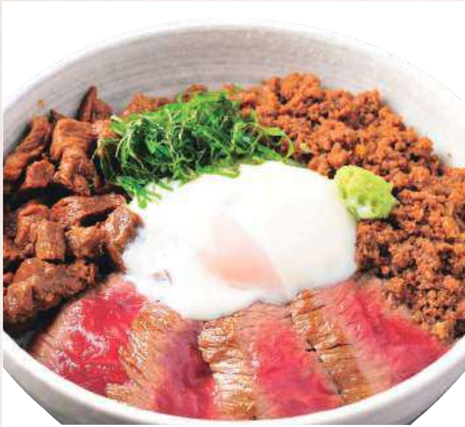
あか牛よかよか丼 スープ付き ..... 1,650円(税込)