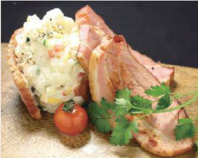
肉屋のポテトサラダ