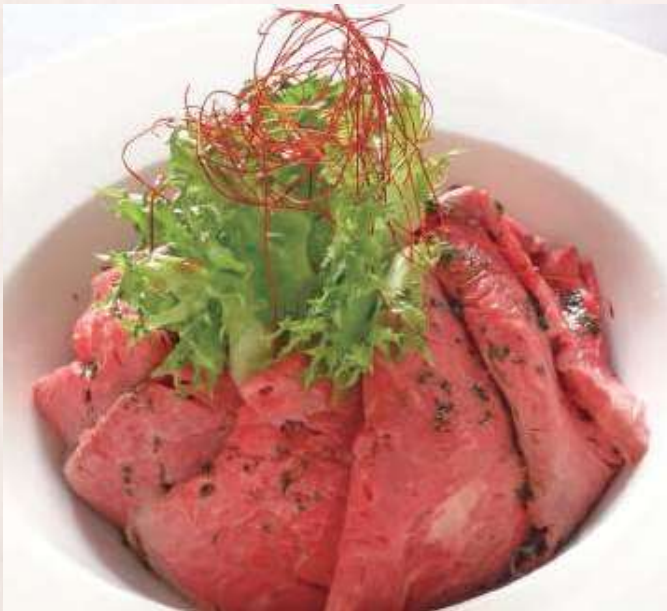
あか牛ローストビーフ丼 スープ付き ..... 1,980円(税込)